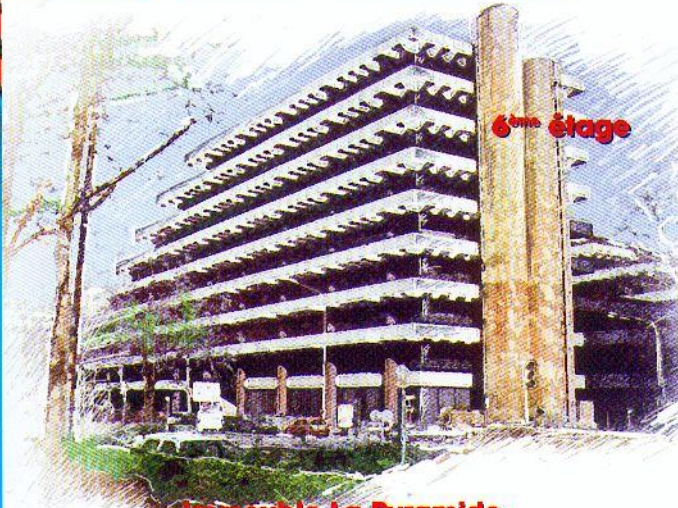
Immeuble La Pyramide 80 avenue du Général de Gaulle - CRETEIL